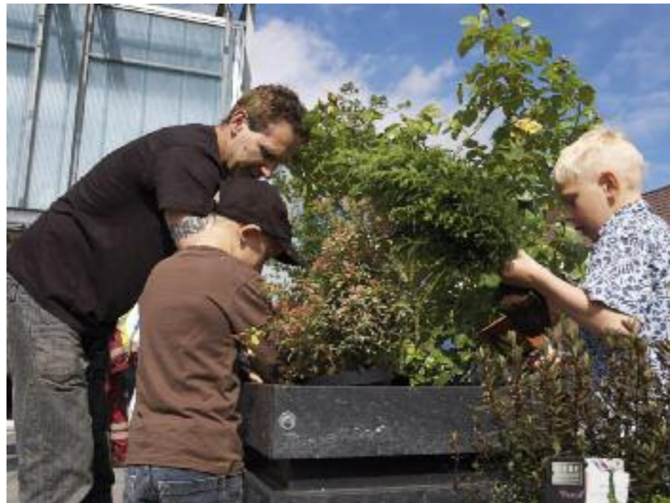
Jonge groene vingers in de Rozenprieel.

Het Rozenprieel is een oude, verstedelijkte wijk met weinig groen. Inmiddels heeft het Geheime Groene Roosgenootschap al verschillende initiatieven genomen om de wijk op te fleuren met bloembakken, geveltuintjes en boomrondjes. Bovendien was er op 16 mei een grote groenactie in de wijk. Wilt u ook iets doen voor meer groen in de buurt? Kijk op www.ggrg.nl .