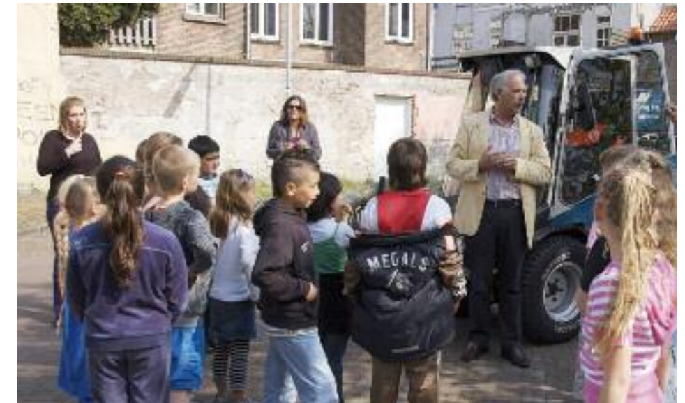
De leerlingen van de Hannie Schaftschool om de hondenpoepzuigmachine.