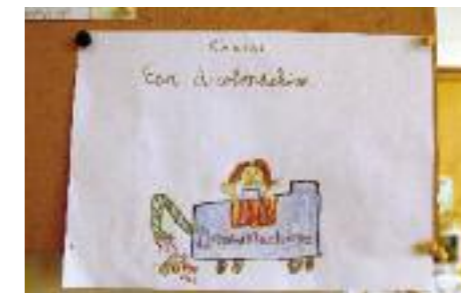
De winnende tekening!

hielp, want de wijk is inmiddels een heel stuk schoner. Voor hondeneigenaren is het trouwens ook een stuk voordeliger om de hondendrollen meteen op te ruimen, want het nieuwe handhavingsbeleid van de gemeente laat er geen gras over groeien; overtreders kunnen rekenen op forse bekeuringen.