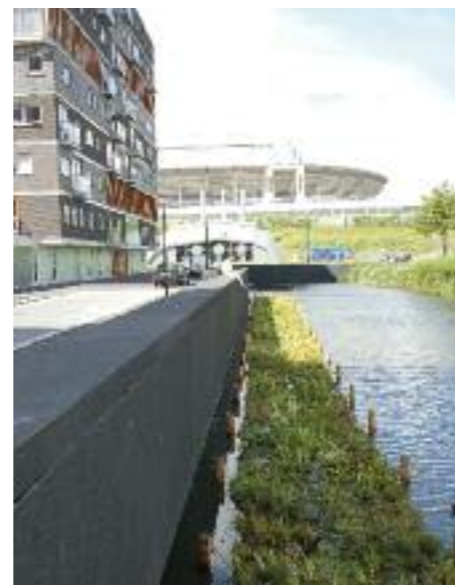
Een drijftuin zoals die volgend jaar te zien zal zijn in het Zuider Buiten Spaarne.

De drijvende tuinen zijn eigendom van de gemeente, maar worden beheerd door de bewoners, onder anderen door Rolf Baron. "Ik zie erop toe dat de tuinen er goed bijliggen. Met mijn bootje kan ik er langs varen en afval weghalen. Het groot onderhoud verzorgt de gemeente."