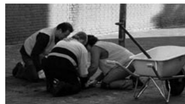
Foto-impressie Buurtschoonmaak 25 september 2008